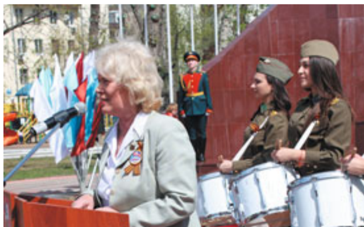
В Лефортово, как и во всех уголках нашей необъятной Родины, широко отметили 70-летие Великой Победы.